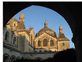
Périgueux - Cathédrale St Front