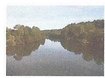
L'Isle à Sourzac