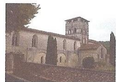
Chancelade - Abbaye