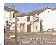
Sorges - le Refuge